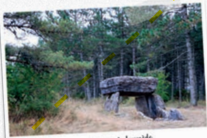
le géant de laumède

Rencontre avec le 1 er dolmen, et pas des moindres : « Lou Gigotte », l'un des dolmens les plus célèbres de nos contrées, grâce à son impressionnante table de 10 tonnes ! Il s'agit là d'un dolmen à chambre double : il possède deux chambres qui se suivent. Des tessons de poterie ont permis de dater une partie du dépôt du bronze final.