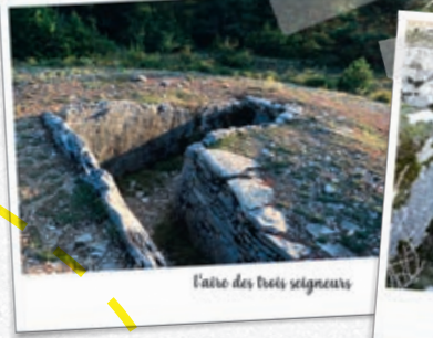
Aire des trois seigneurs

Après les menhirs de Roumaldis, continuer sur la même piste et suivre les indications.