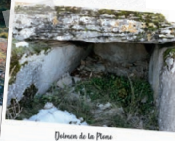
Dolmen de la Plone