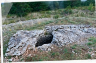
Dolmen de Dignas

Prendre la route qui mène du hameau du Bac à Dignas sur environ 1 km. Arriver au niveau de la piste qui monte sur la droite, laisser le véhicule et continuer à pied jusqu'au dolmen.