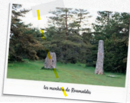
les menhirs de Roumaldis

En face du hameau des Claviers, emprunter la piste carrossable qui mène à la carrière sur environ 1,2 km.