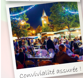
Convivialité assurée !