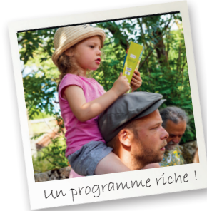
Un programme riche !

Au champ des Courses Julien Delagnes Maraîcher bio