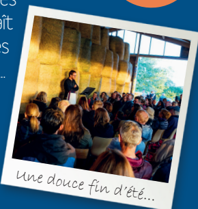
Une douce fin d'été...

Dans la famille poule blanche, tous les enfants sont blancs, mais quand naît le n'oeuf... il est noir. Question des origines, différences, transmission... Ça va remuer dans l'poulailler, quitte à déplaire à la belle rouge. Que voulez-vous, on ne fait pas d'omelette sans casser des oeufs !