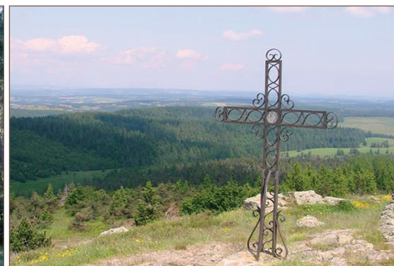
Croix au belvédère du Moure de la Gardille