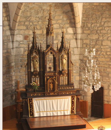
Retable de l'église

Àu XII e siècle, la paroisse dépendait des moines de La Chaise-Dieu. Au XVIII e siècle, le Conseil général de l'Administration départementale de Lozère lui donna le nom de « Bel Air », notamment pour son aspect perché, sur les hauteurs. En 1837, une partie du territoire communal est cédée pour la création de la commune de Chambon-le-Château (qui le deviendra en 1896), ce qui représenta une perte de population de 415 habitants.