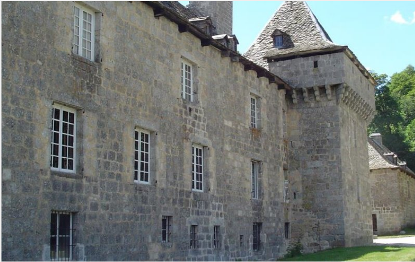
Ch teau de la Baume (OT Aubrac Loz rien)