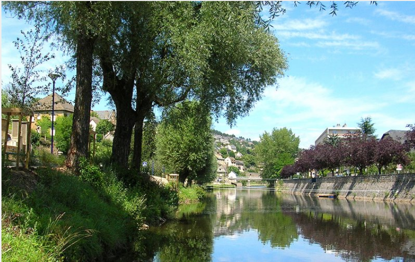
Bords du Lot à Mende (FS - OTI Mende)