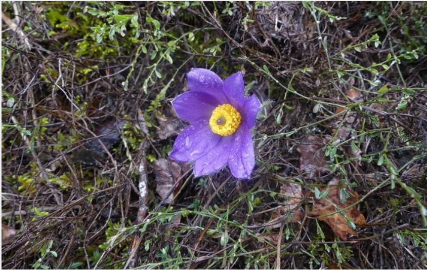
Anémone pulsatile (nathalie.thomas)