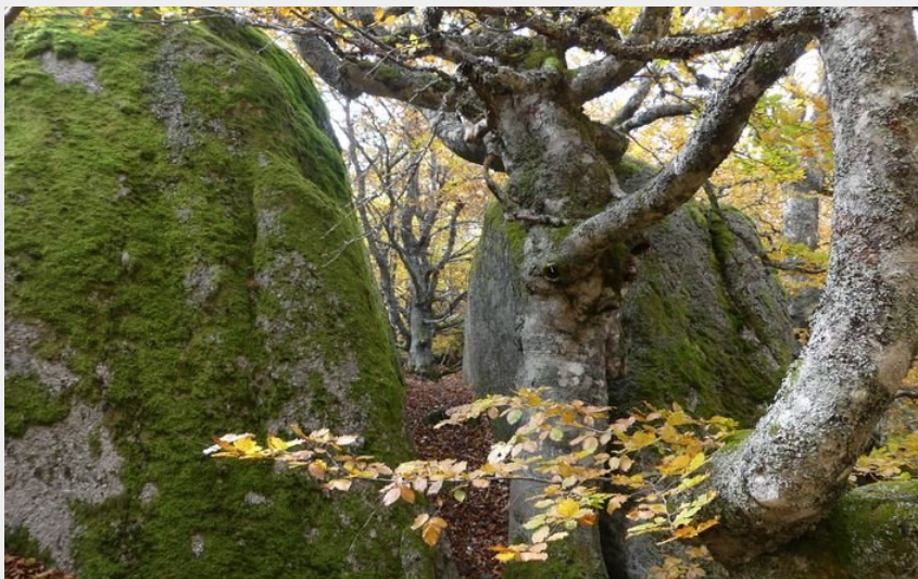
La forêt magique (Nathalie Thomas)