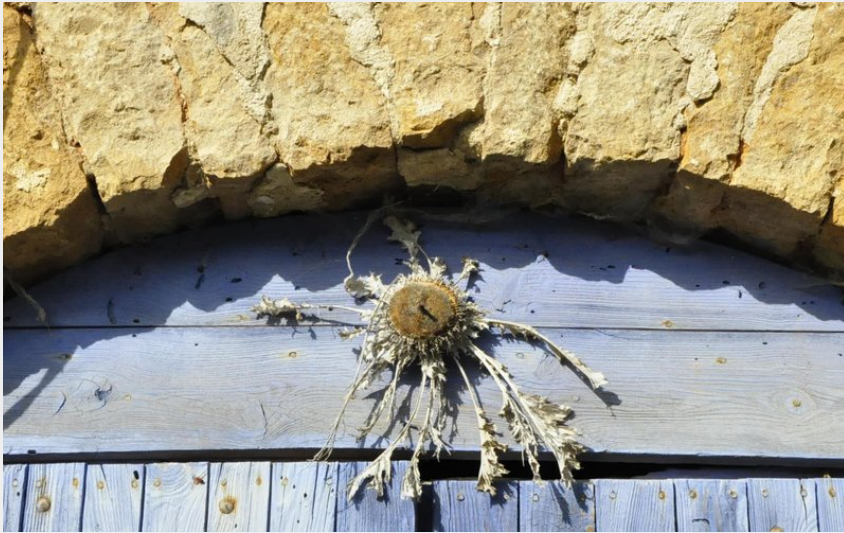
Chardon sur une porte (OTAGDT)