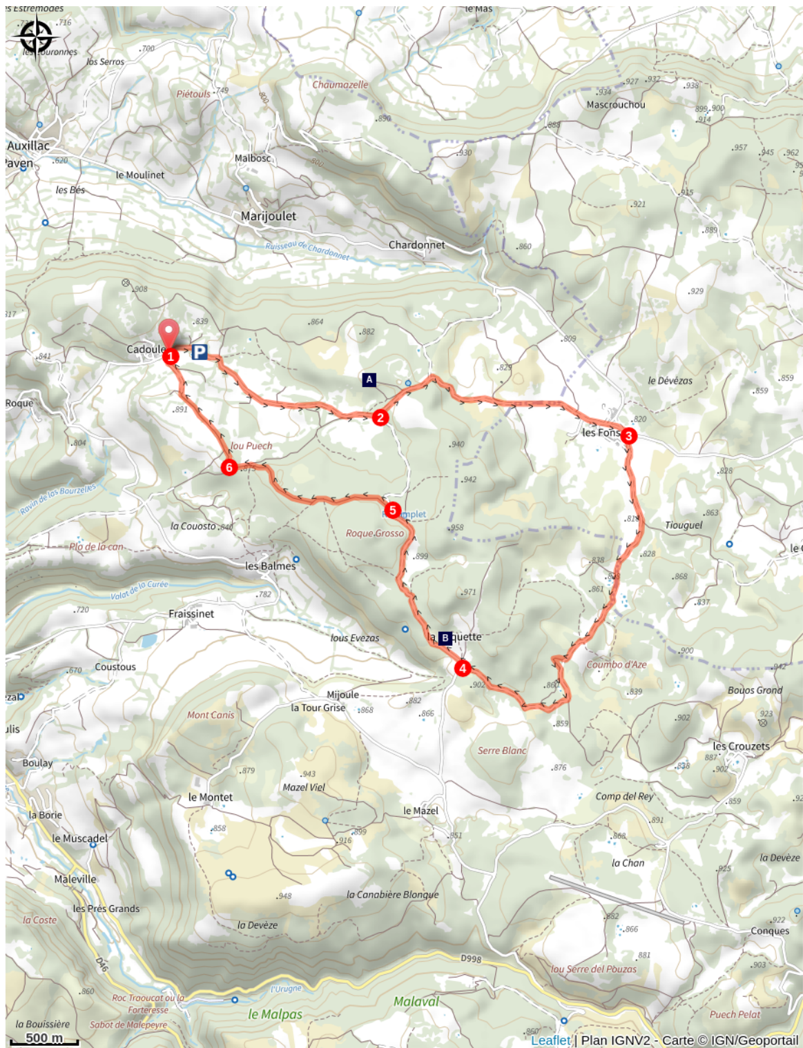
Dolmen de Chardonnet (A)