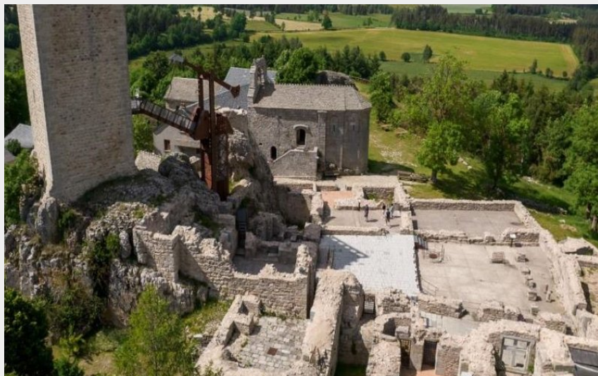
Tour d'Apcher (Benoît Coulomb)