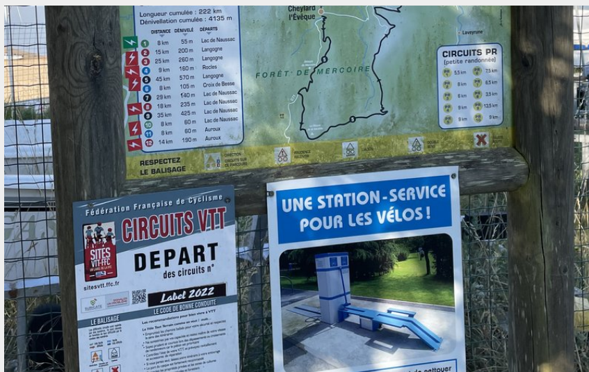
Panoramique des circuits VTT au départ de l'itinéraire