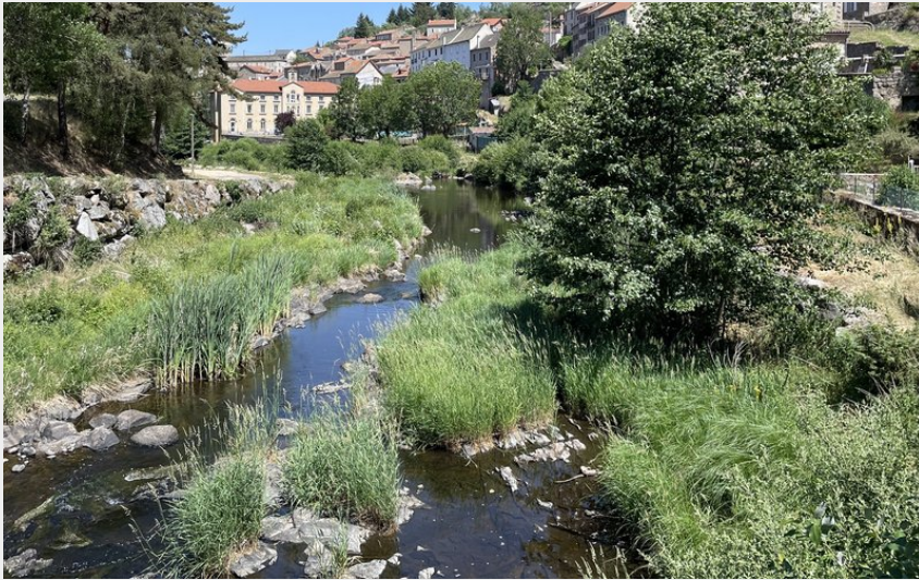
Le Chapeauroux dans la traversée d'Auroux