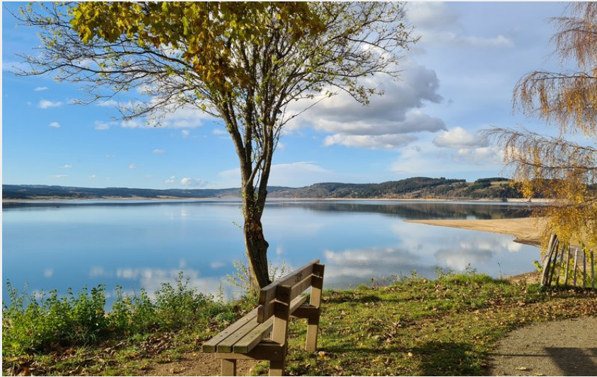
Prendre le temps sur le chemin