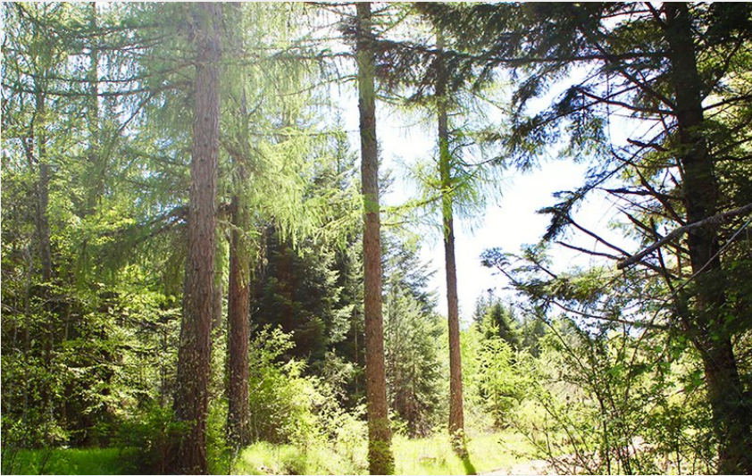
La forêt du Causse de Mende