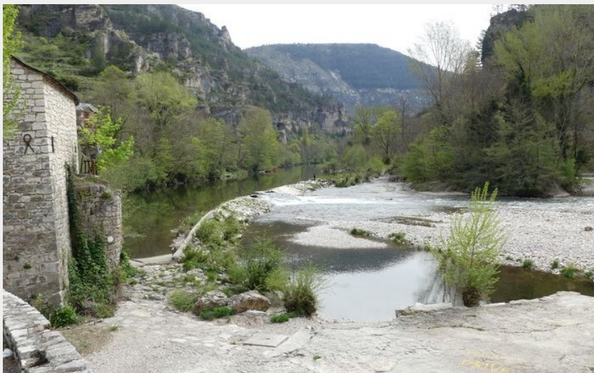
Le Tarn à Sainte-Enimie