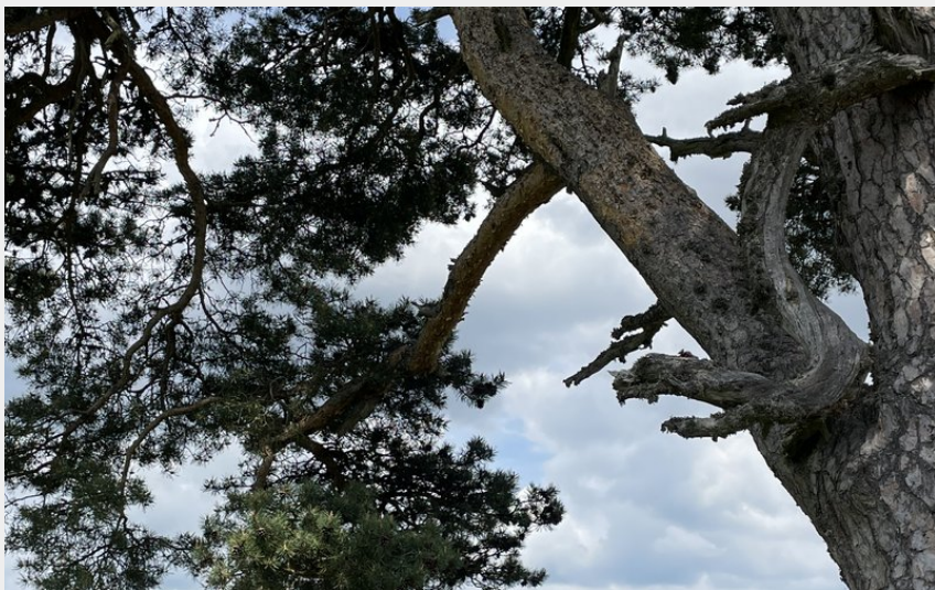
Point de vue sur la vallée de l'Allier et le Velay