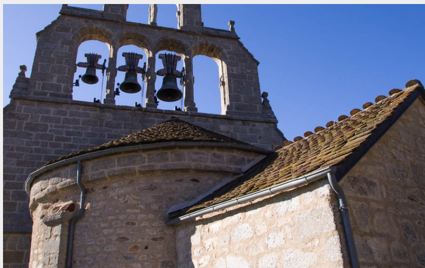
Eglise de St-Privat-du-Fau