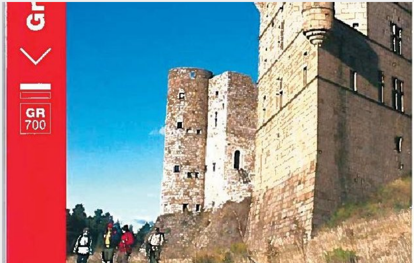
Topo guide, le chemin de Régordane (nathalie.thomas)