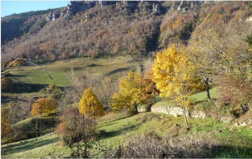
Vue sur les corniches