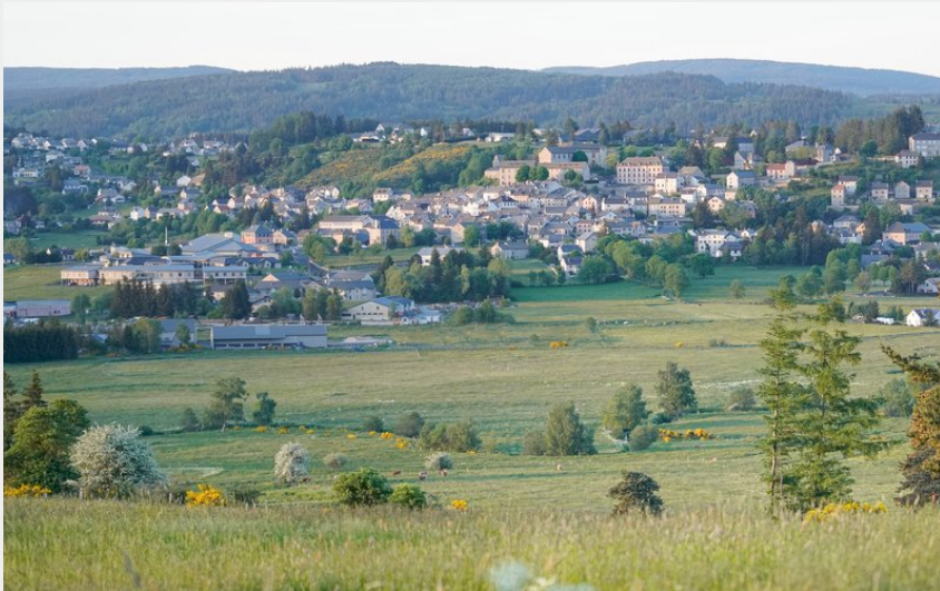
Saint-Alban-sur-Limagnole (JS Caron - OT Margeride en Gévaudan)