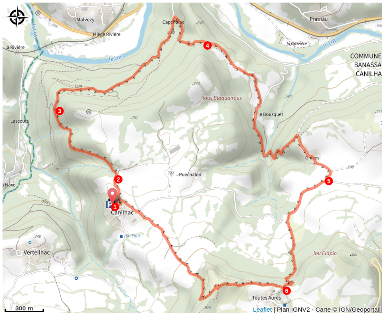
Château de Canilhac (A)