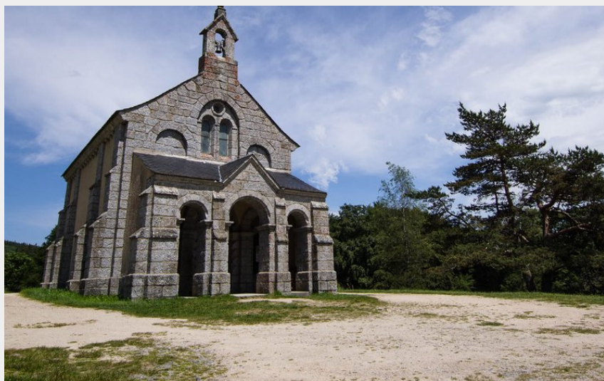
La chapelle Saint Roch