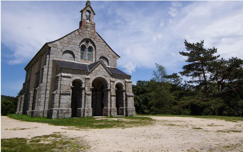
La chapelle Saint Roch