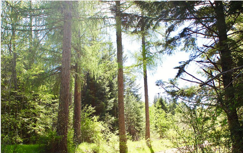
La forêt du Causse de Mende