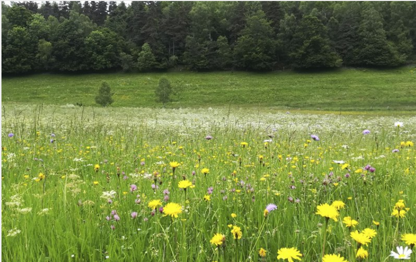
Des fleurs par milliers dans les prés