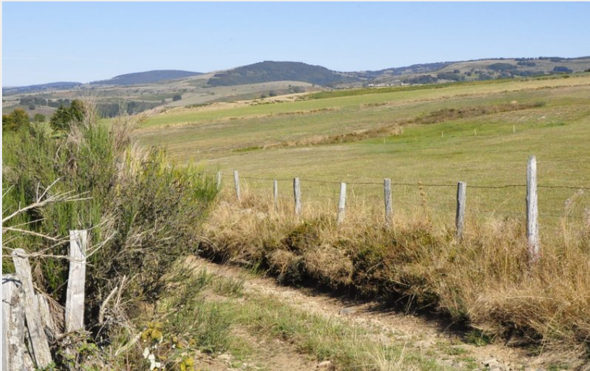
Les monts d'Aubrac depuis le chemin de crête (OT de l'Aubrac aux Gorges du Tarn)