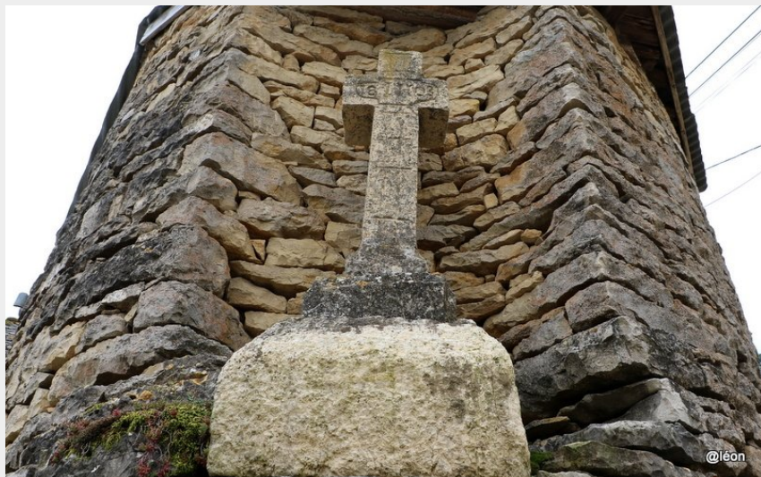
Croix à la Rocherousse (Léon Trousselier)