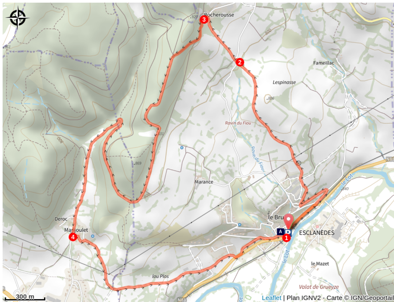
Le Bruel d'Esclanèdes (A)