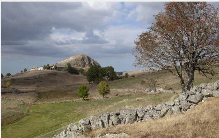
Aubrac (Floris Fossey - OTCCGD)