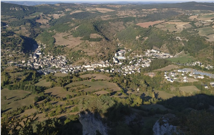
Vue sur la Canourgue