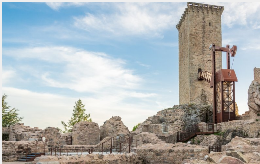
La Tour d'Apcher (Ludo Visuel)