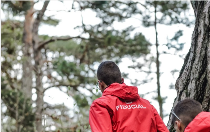
Traileurs sur le Causse