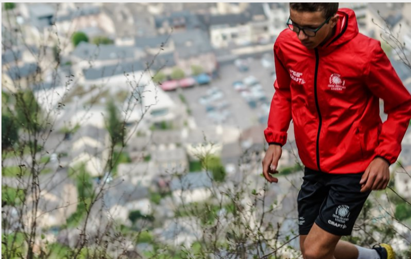
Traileur au dessus de Mende