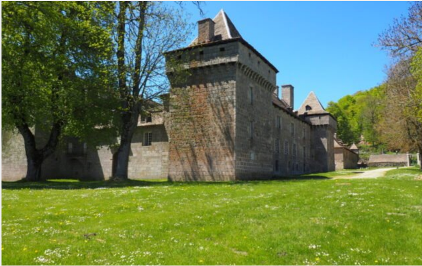
La Tour du Château de la Baume