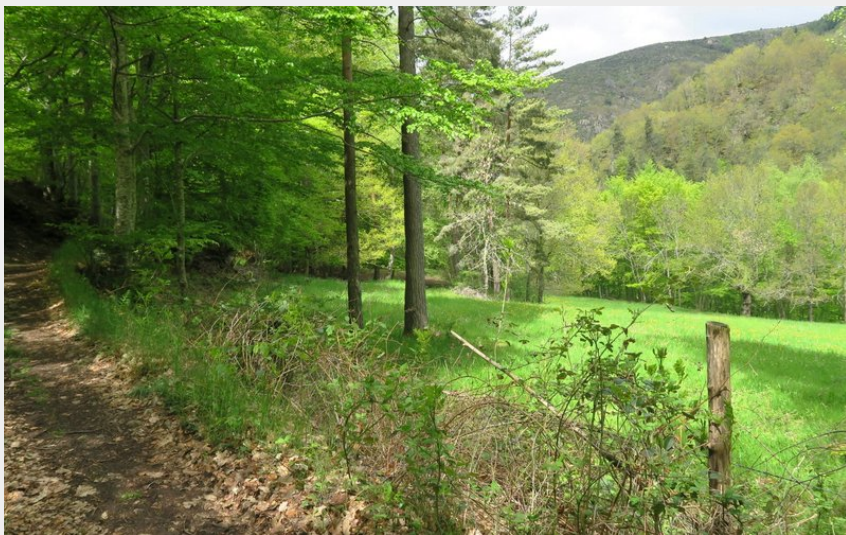
L'ambivalence du parcours entre ombrage et trouées de verdure ensoleillées (PNR Aubrac)