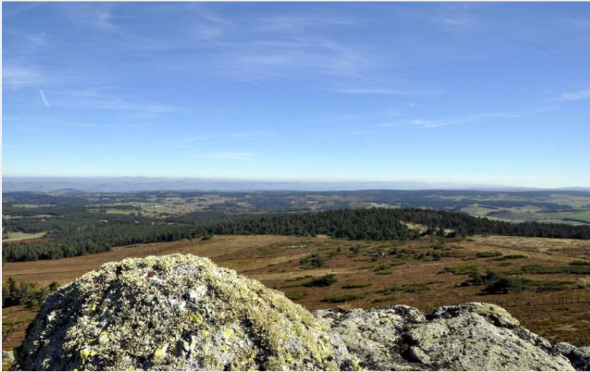
Horizon depuis le Roc de Fenestre