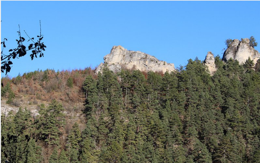
Le rocher surnommé "le lion de Balsièges"