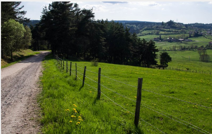
Le petit Mourione