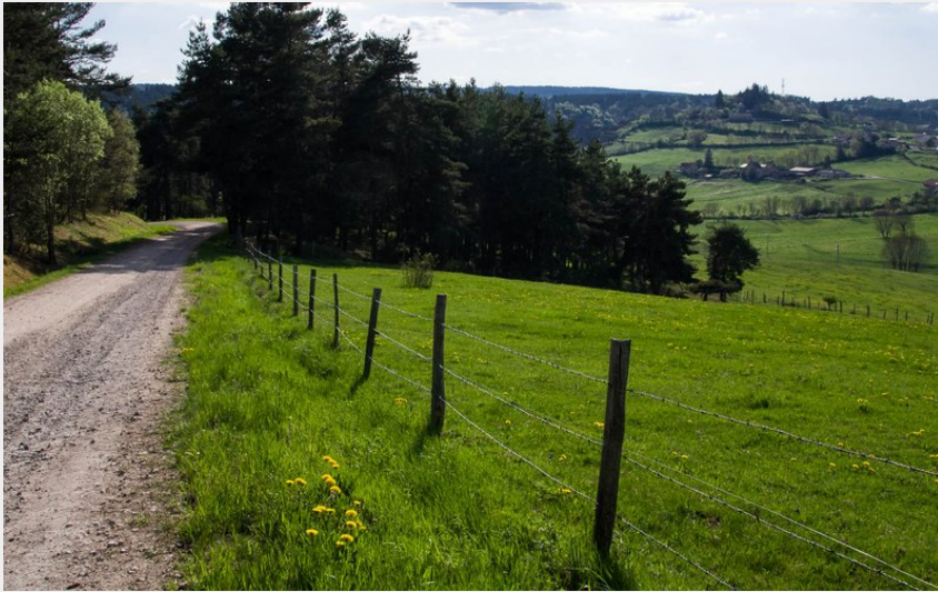
Le petit Mourione