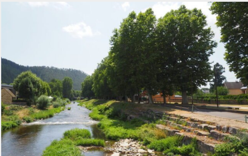
Les abords de la Colagne (Office de Tourisme Gévaudan Destination)