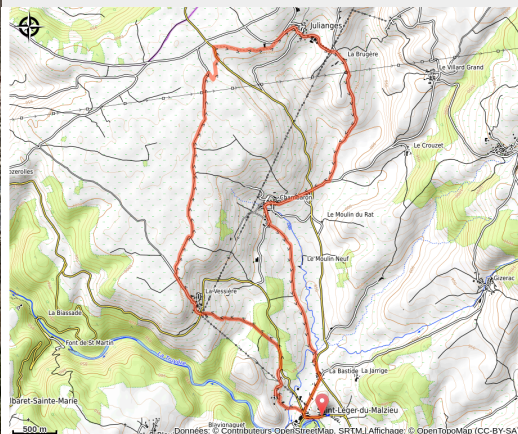
Village de la Vessière et les Monts de la Margeride

Une randonnée quelque peu vallonnée où vous évoluerez sur de larges chemins de terre à la découverte de villages typiques.