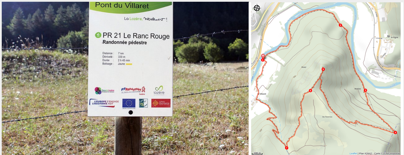
Panneau départ du sentier Ranc Rouge

Ce circuit, au départ du pont du Villaret, vous fera remonter le long du Lot sur sa rive gauche avant de grimper sur un éperon du Causse de Sauveterre dominé par le "Ranc rouge". Cette déformation du mot occitan "ronc" signifie "rocher" : ici, le calcaire est teinté de rougeâtre par des oxydes de fer. De ce point haut, la vue embrasse la vallée du Lot et la Margeride. En chemin, la fontaine de Saint-Véran évoque le premier emplacement du village de Barjac.