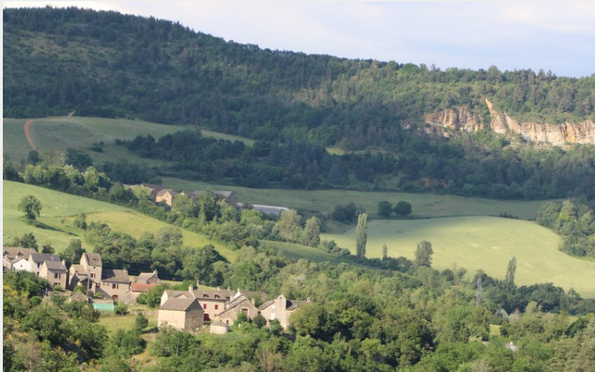
Chabannes et la ferme de Malavieille vus du Villard Sentier des saliens