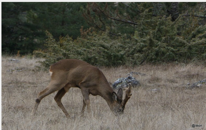
Chevreuil en velours (Léon Trocellier)