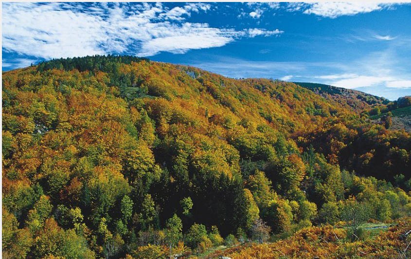
Hêtraie du Marquairès