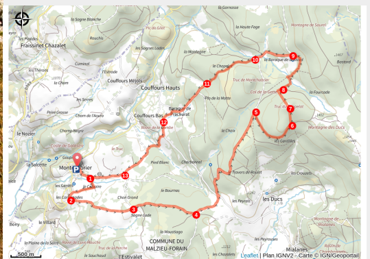
Le truc du Chapelat