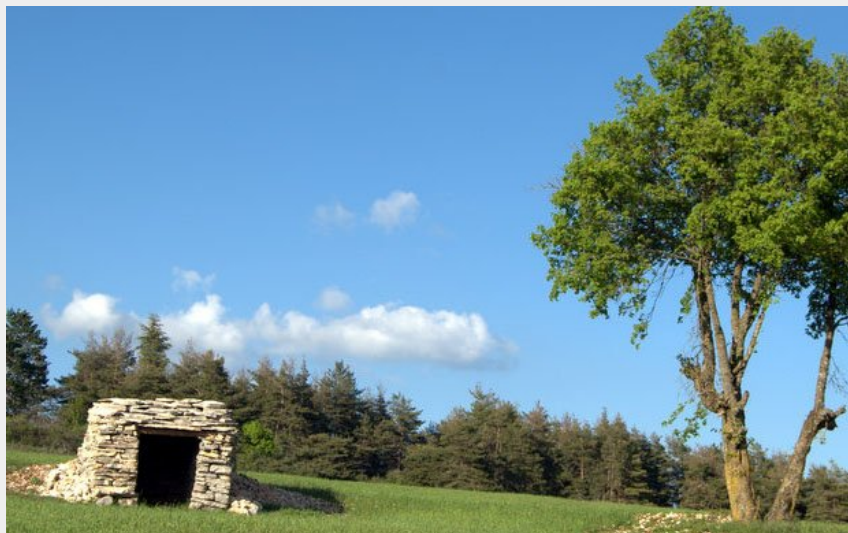
Chazelle rénovée par une association sur le bord de la piste (Léon Troucellier)