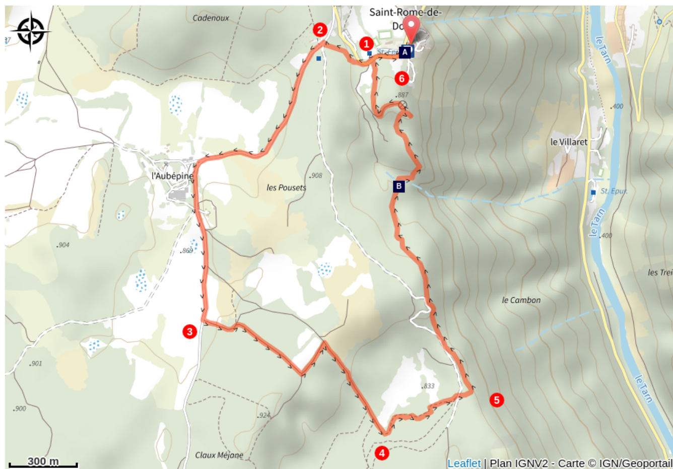
Saint Rome de Dolan (A)