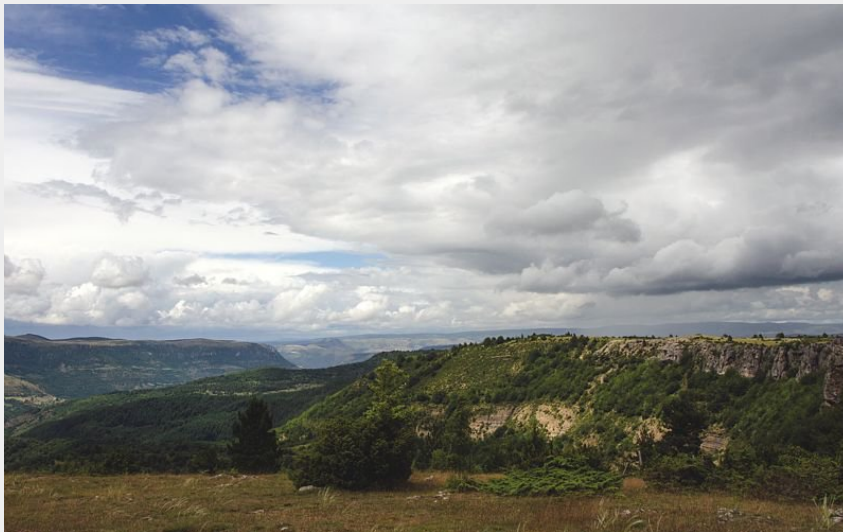
Corniche La Can de l'Hospitalet (Olivier Prohin)