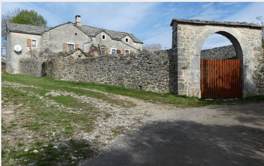
Le village de Drigas (nathalie.thomas)