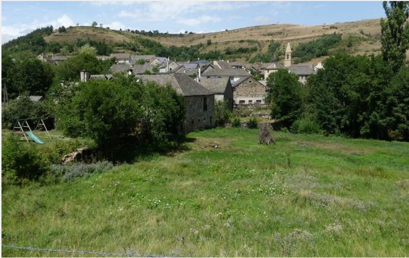
Cubières (© Nathalie Thomas)