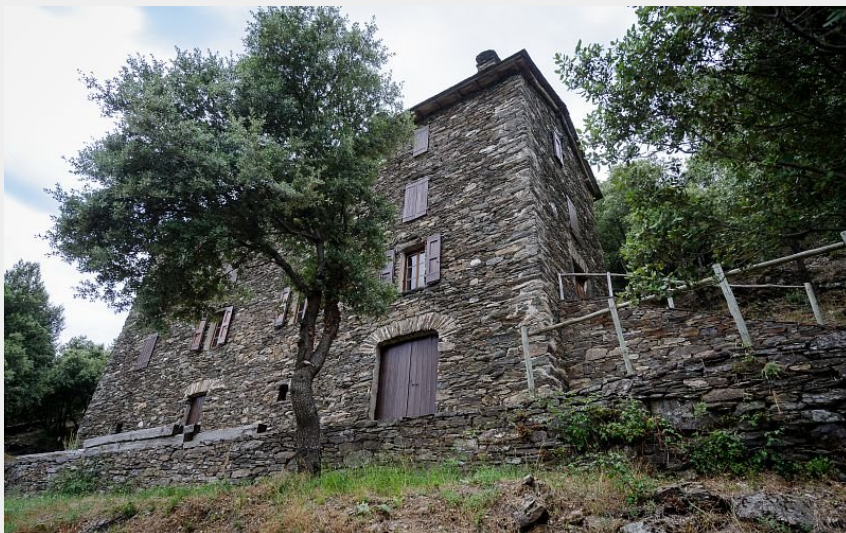
Magnanerie de La Roque