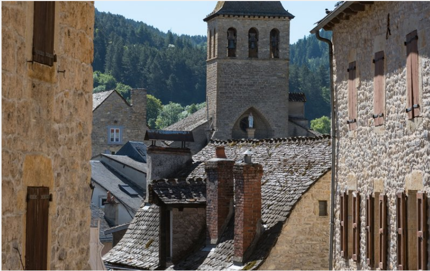
Rue de Chanac et son église